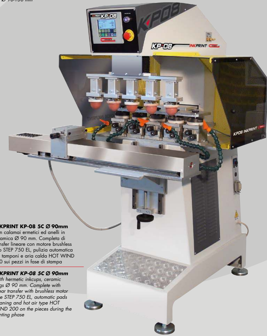
INKPRINT KP-08 5C Ø 90mm Con calamai ermetici ed anelli in ceramica Ø 90 mm. Completa di transfer lineare con motore brushless tipo STEP 750 EL, pulizia automatica dei tamponi e aria calda HOT WIND 200 sui pezzi in fase di stampa