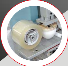
PULIZIA TAMPONI (OPZIONALE) La pulizia tamponi è automatica e programmabile direttamente dalla tastiera