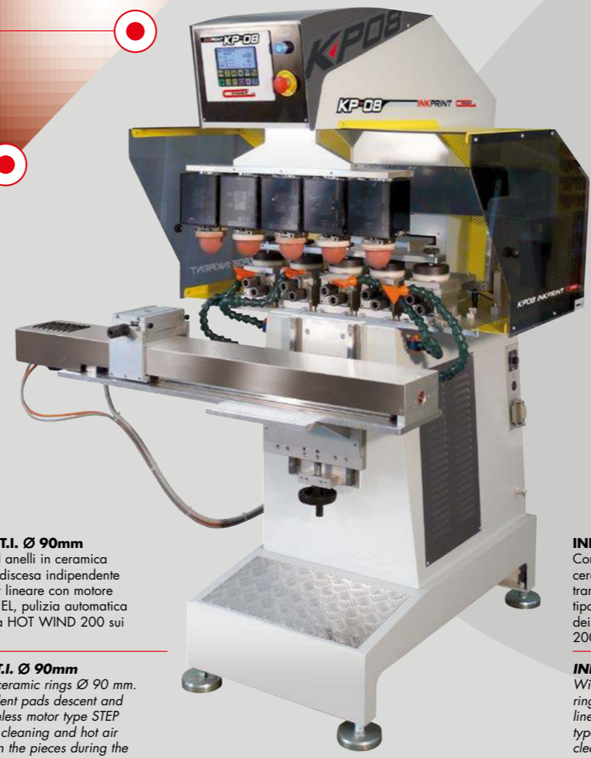
INKPRINT KP-08 5C T.I. Ø 90mm Con calamai ermetici ed anelli in ceramica Ø 90 mm. Completa di discesa indipendente dei tamponi e di transfer lineare con motore brushless tipo STEP 750 EL, pulizia automatica dei tamponi e aria calda HOT WIND 200 sui pezzi in fase di stampa