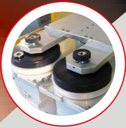
CALAMAIO ERMETICO La INKPRINT KP-08 utilizza calamai ermetici con anello in ceramica da Ø 90-130 mm